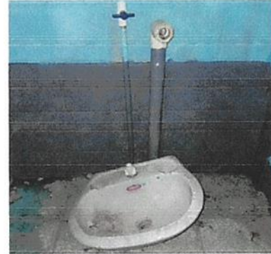
Foto 2: Mejoramiento de Instalaciones potables y colocacion de lavamanos nuevos ✓