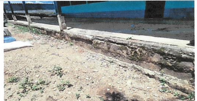
Foto 6: mejoramiento de cimentación del patio más construcción de ingresos por medio de gradas y rampas y pasamanos. ✓

Observación: Si es necesario se pueden agregar hojas adicionales y actualizar el número de hojas.