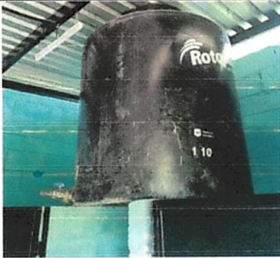
Foto 3: fabricación de pedestal metalico para colocación de tinacos ✓